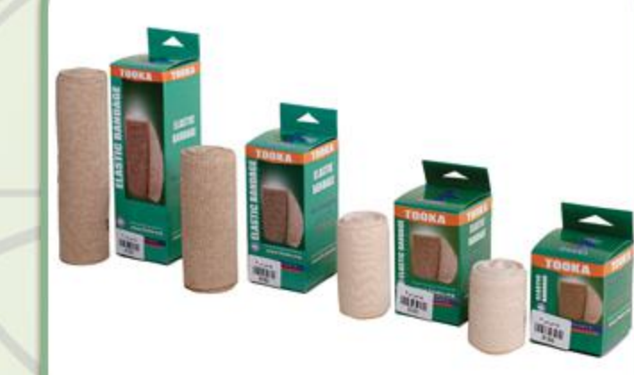
باند کشی (۵-۷-۱۰-۱۵) سانتی

Dressing Bandage 5-7-10-15CM 81292-81291-81210-81212