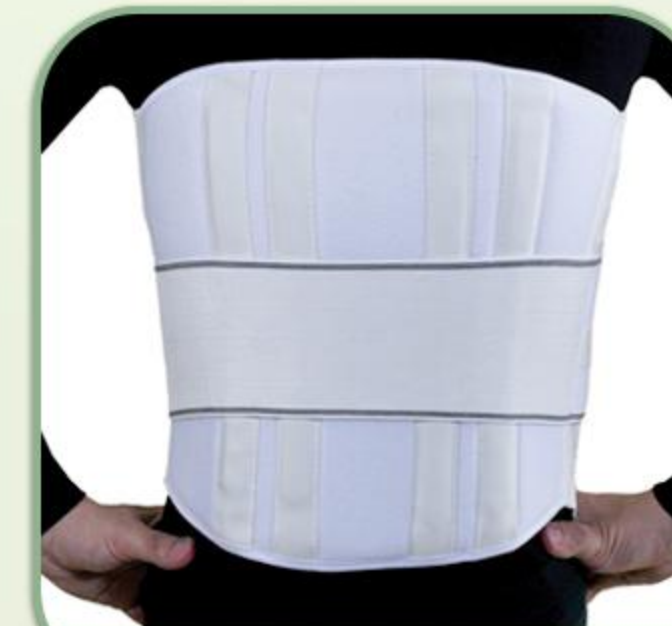
کمر بند طبی نرم