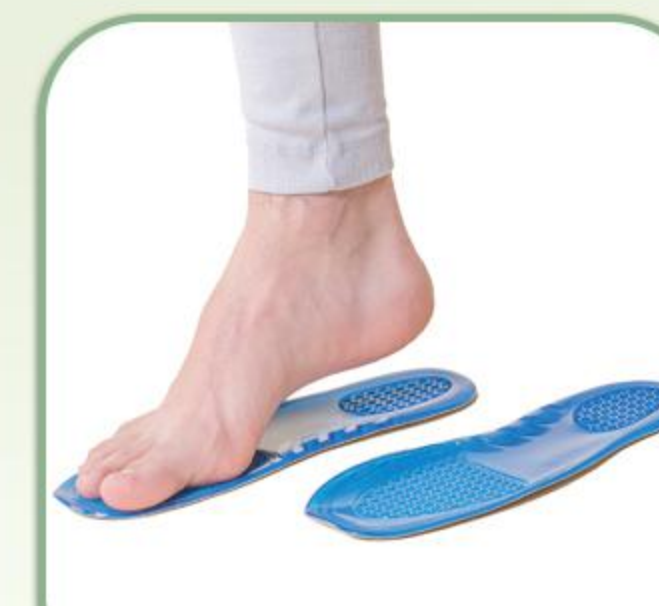
کفی طبی روکشدار مخملی

Medical Insole With Velvet Coating 815400401