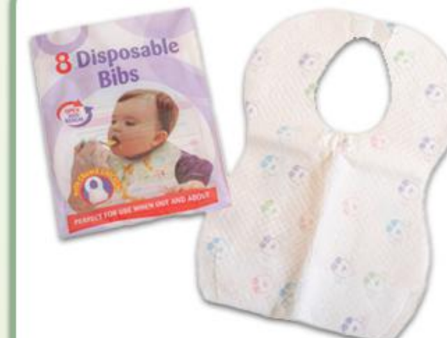
پیشبند یکبار مصرف بچگانه (۸ تایی)