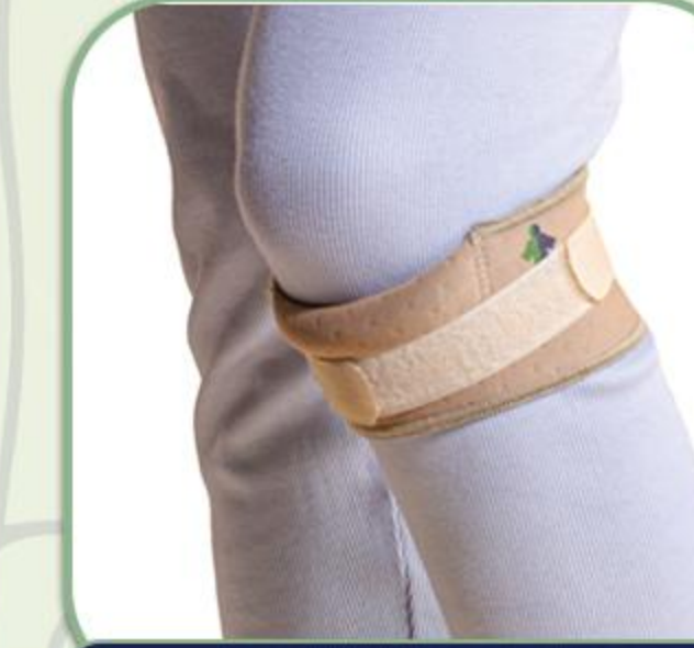
پد کشکک زانو (پتلا بند)