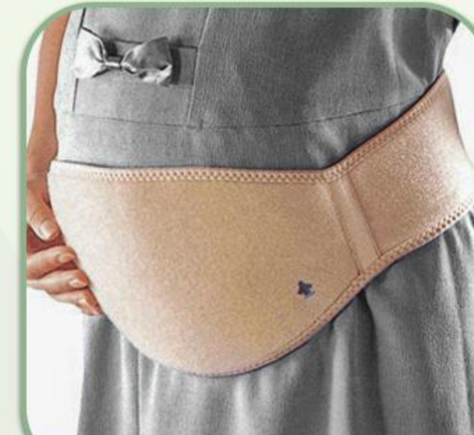
شکم بند دوران بارداری - F