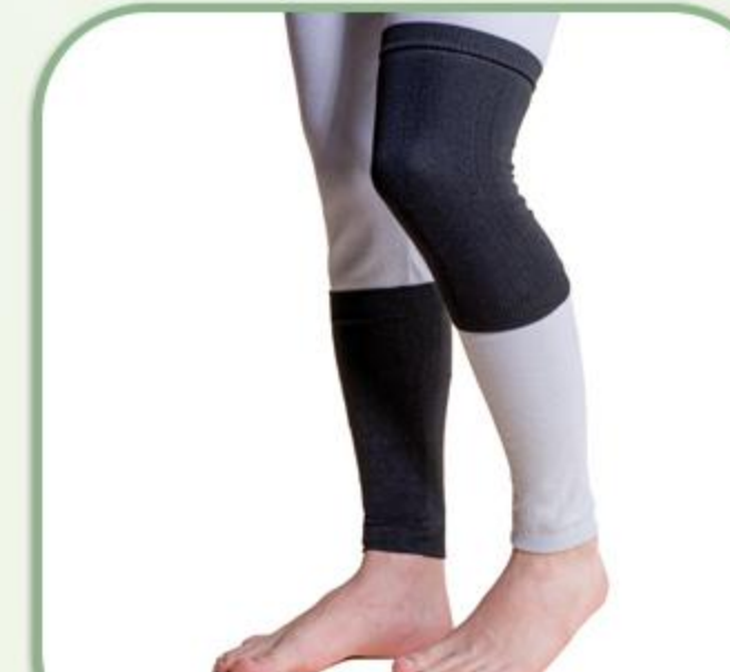
ساق بند زانوبند الاستیک