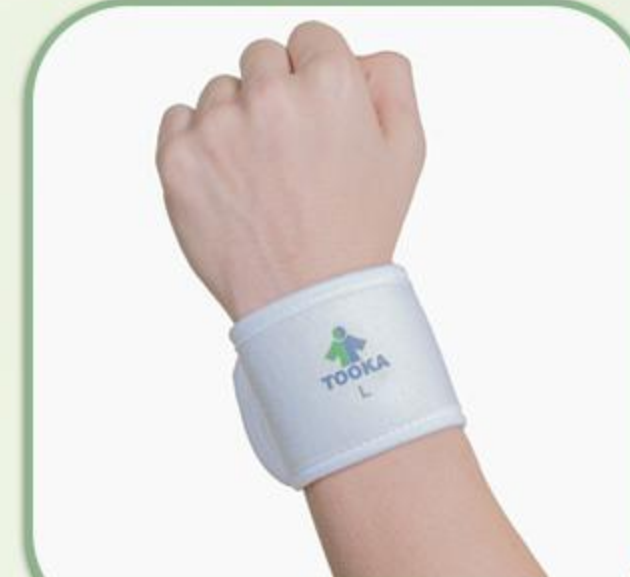
مچ بند نرم قابل تنظیم اسفنجی