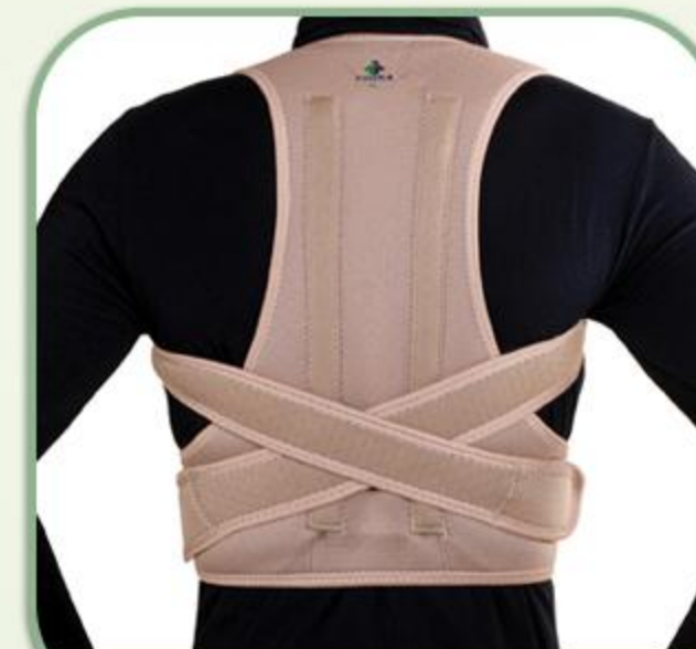
قوزبند پل دار