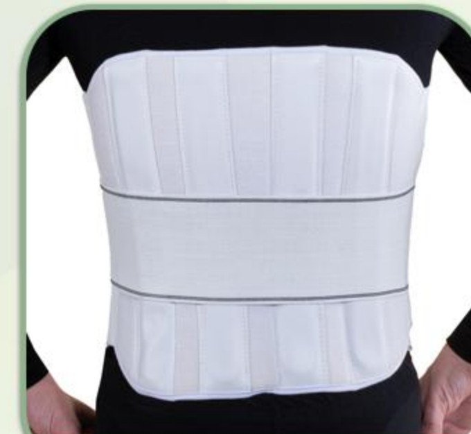
کمر بند طبی سخت (کمر فنردار)