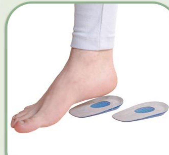
پد خار پاشنه روکش دار مخملی (ژله ای)