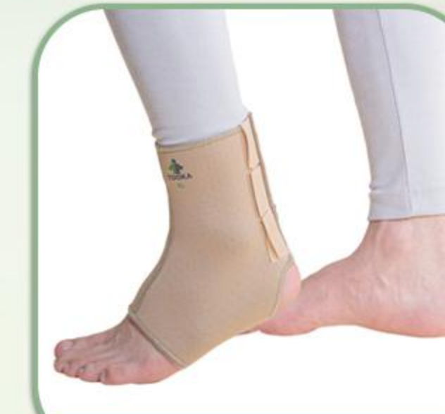
انگل ساپورت پشت باز