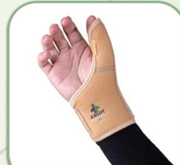
شست بند آتل دار