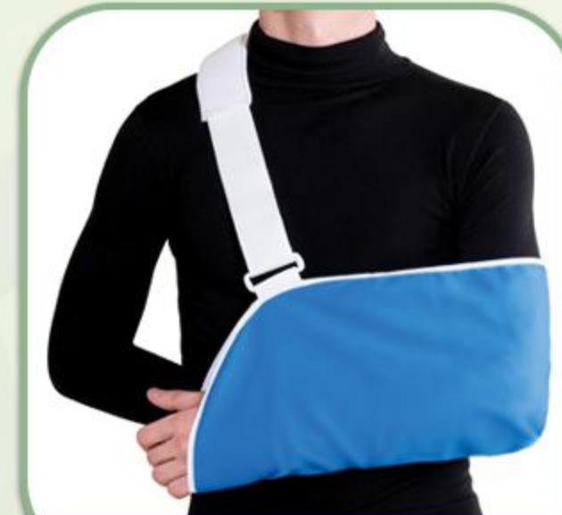
آویز دست صادراتی