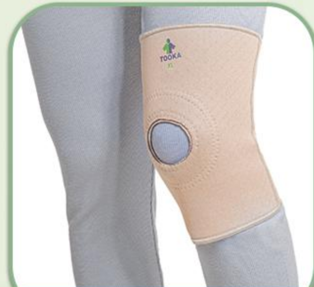
زانوبند طرح آمریکایی