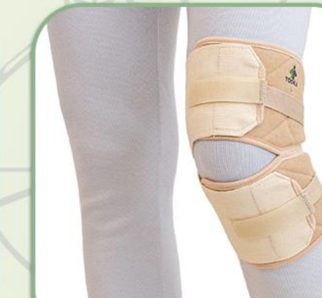
زانوبند قابل تنظیم (باشکک باز)

Adjustable Knee Support 81129 Closed Patella Buttres