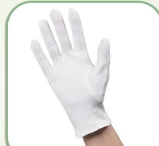
دستکش نخ طبی