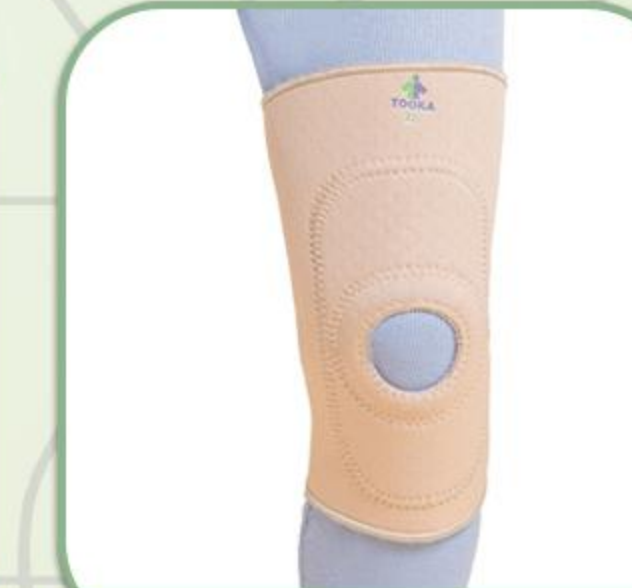
زانوبند پددار ساده