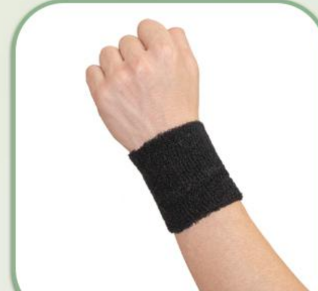
مچ بند حوله ای