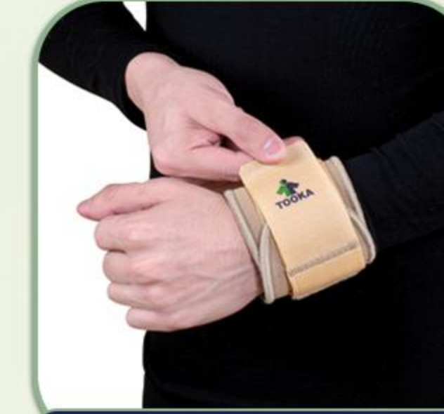
مچ بند قلابدار قابل تنظیم