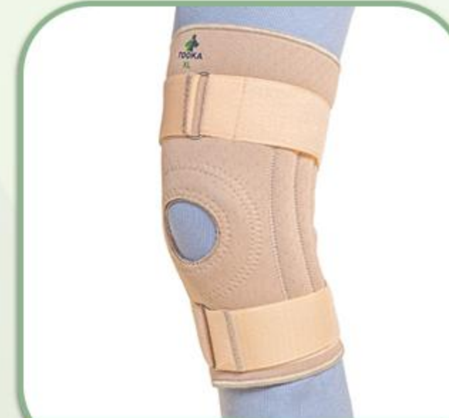
زانو بند چهار فنره