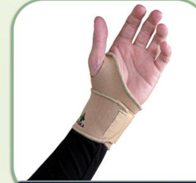
مچ بند کف بند ضربدری