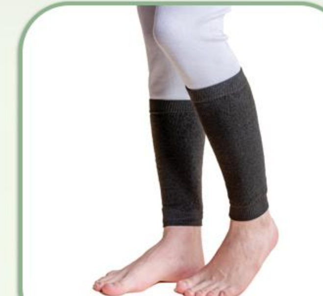
ساق بند زانوبند حوله ای