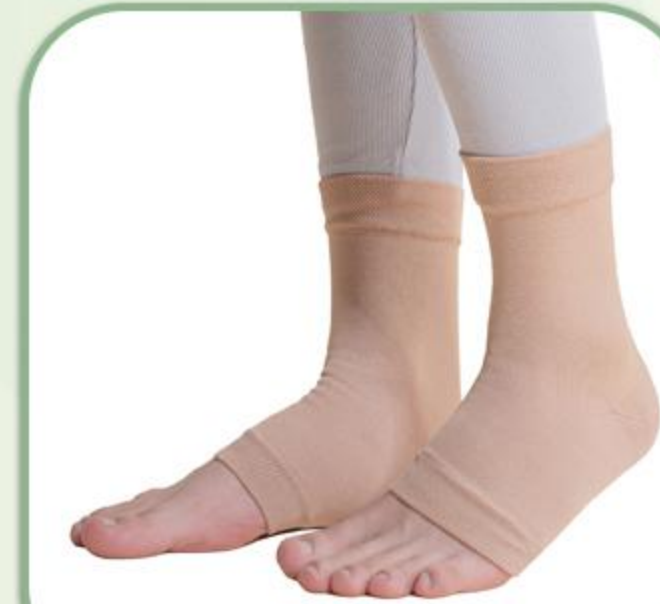
قوزک بند الاستیک