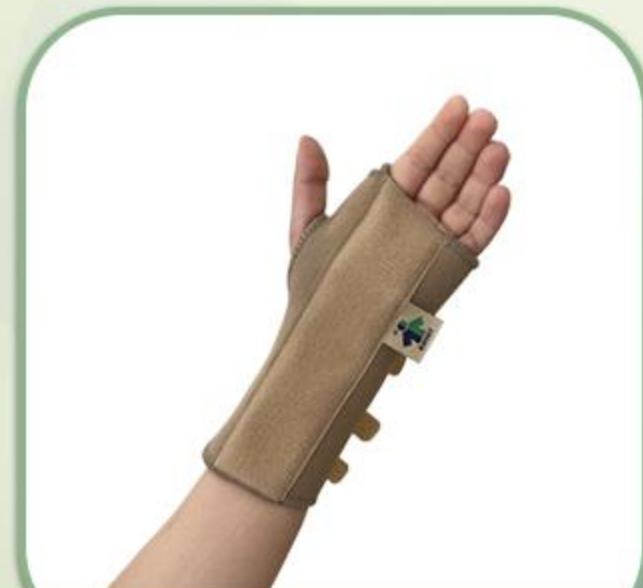
مچ بند فانکشنال