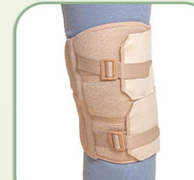
زانوبند قابل تنظیم (باشکک بسته)

Adjustable Knee Support 81129 Closed Patella Buttres