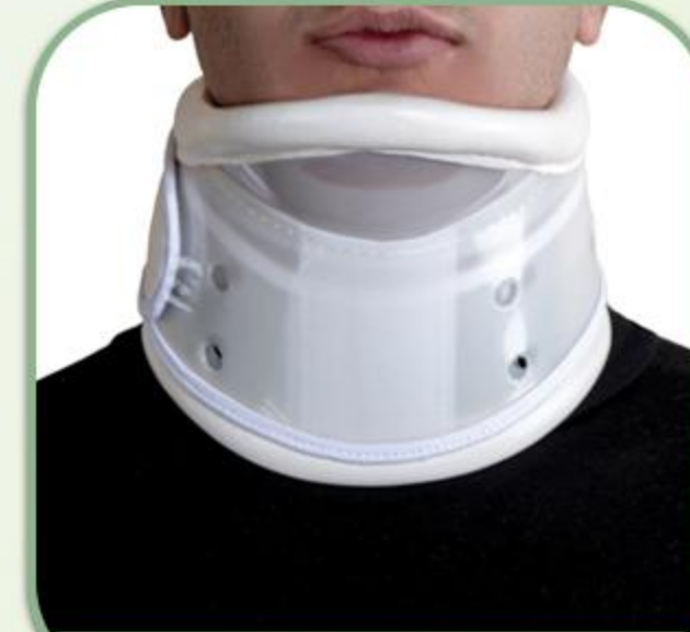
گردن بند سخت چانه دار صادراتی