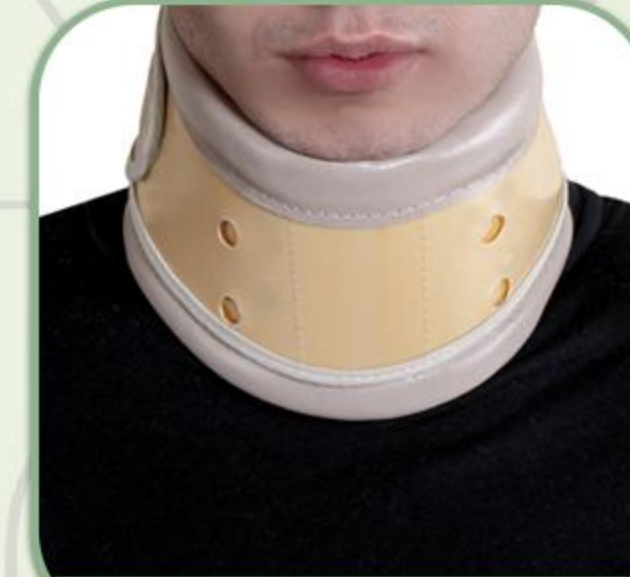
گردن بند طبی سخت صادراتی