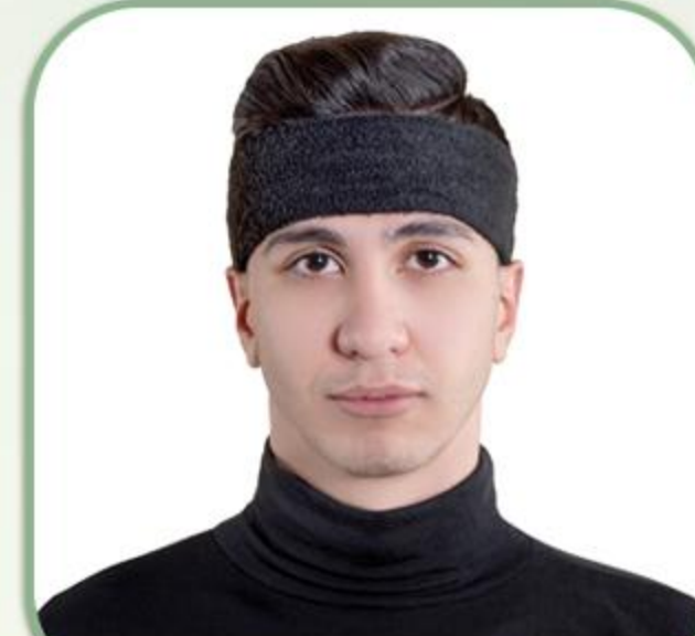
هد بند حوله ای