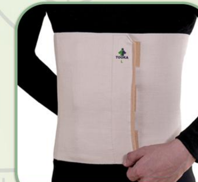
شکم بند زیبایی قابل تنظیم