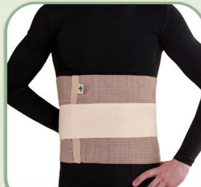
گرم کن کلیه پشمی

Woolen Abdominal Support (Without Bar) 81097