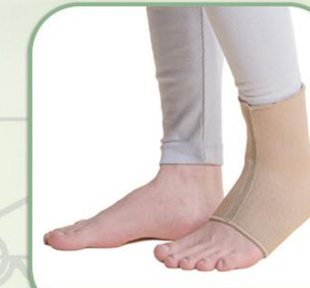
انگل ساپورت جورابی ساده