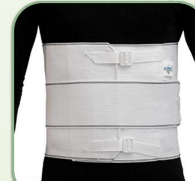
شکم بند تمام کش پلدار

Elastic Abdominal Support (whit soft bar) 81067