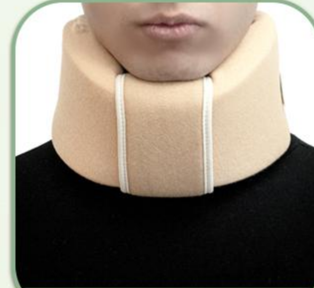
گردن بند طبی اسفنجی