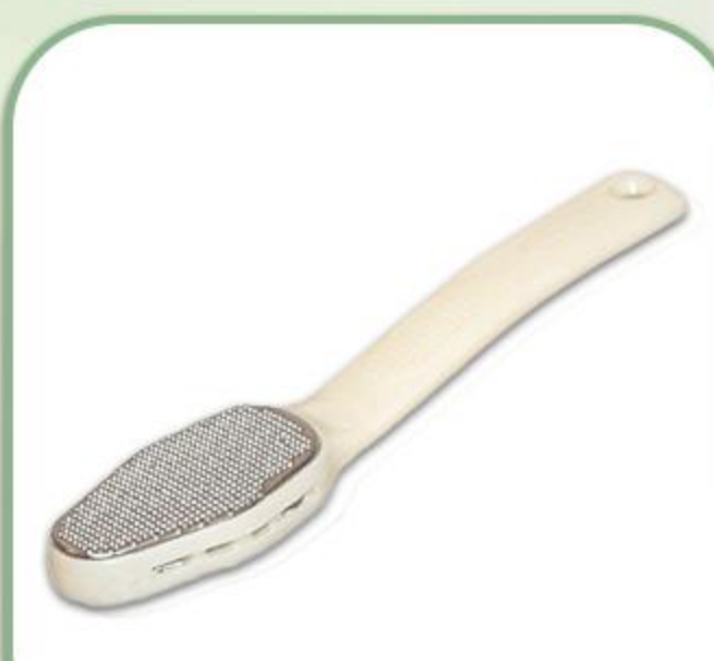
سوهان طبی پاشنه

Adjustable Knee Support 81123 Open Patella Buttres