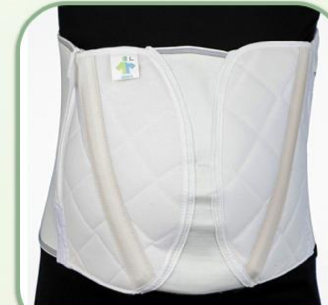
شکم بند دوران بارداری