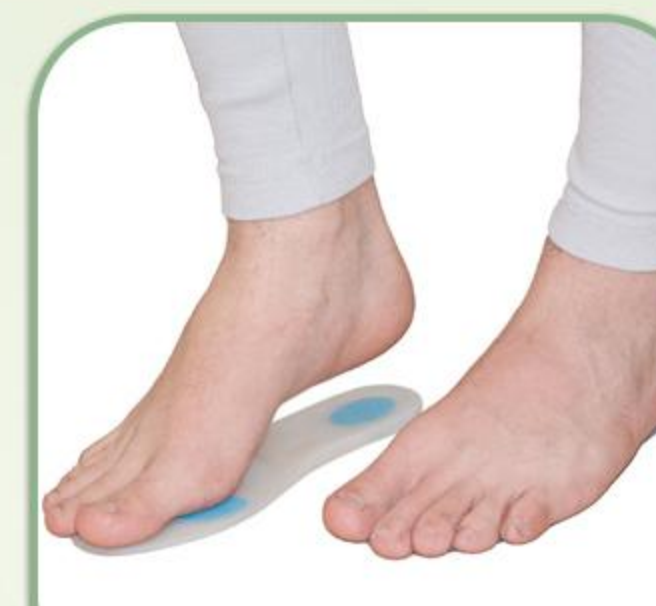
کفی طبی سیلیکونی