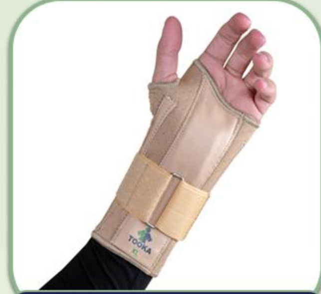
کوکاپ آمریکائی (مچ بند آتل دار)