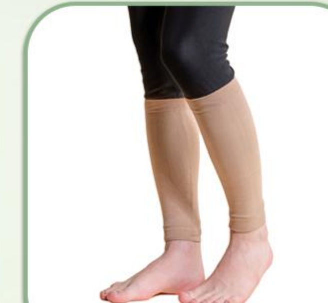
جوراب واریس طرح سوئسی