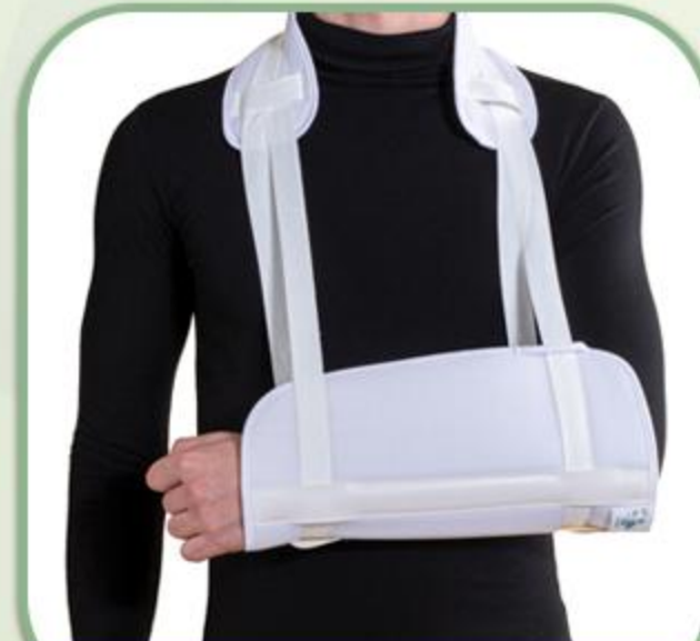
آویز دست (چپ و راست)