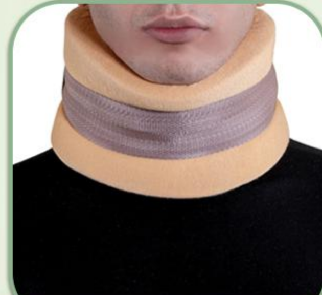
گردن بند طبی اسفنجی F