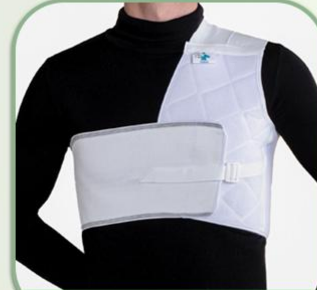
کتف بند یکطرفه (چپ و راست)