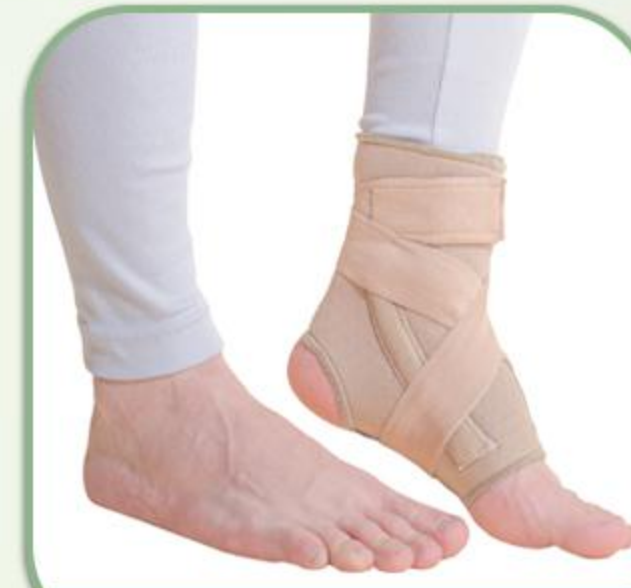
انگل ساپورت فنردار ضربدری