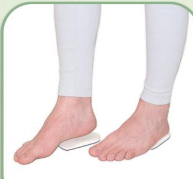
پد خار پاشنه