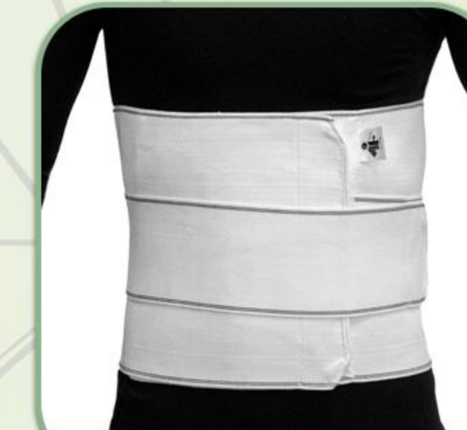
شکم بند تمام کش

Elastic Abdominal Support (whit soft bar) 81067