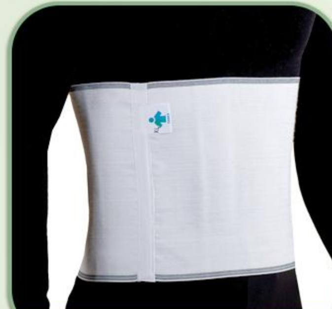
شکم بند تمام کش زیبایی