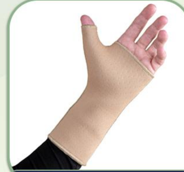
کوکاپ شست بند ساده