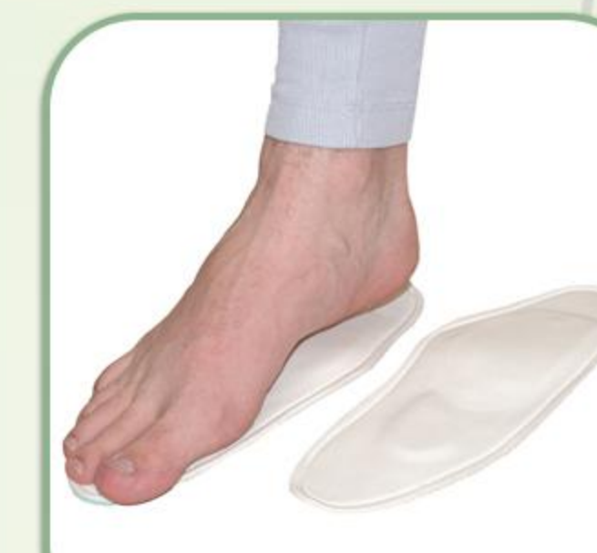
کفی طبی پنجه دار

Medical Insole With Velvet Coating 815400401