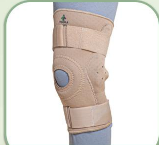
زانوبند مفصل دار دنده ای دو محوره