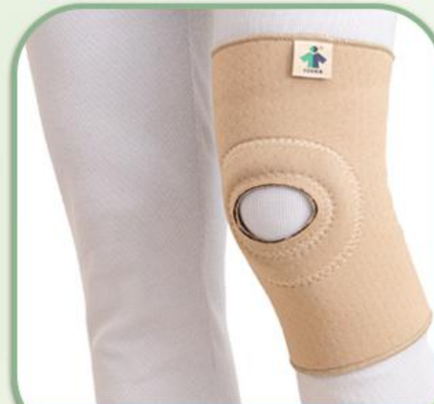
زانوبند ساده بلند