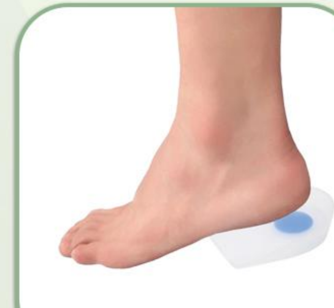
پد خار پاشنه سیلیکونی