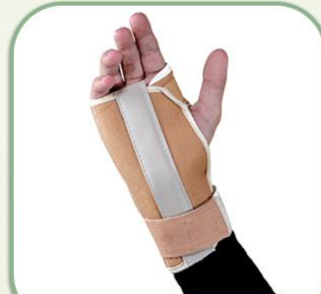
مچ بند فانتکشنال فنر دار (چپ و راست)