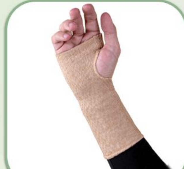
کف بند دست الاستیک