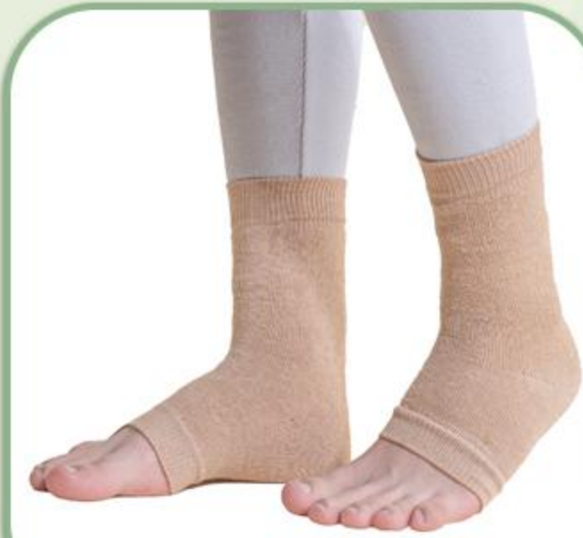
قوزک بند حوله ای