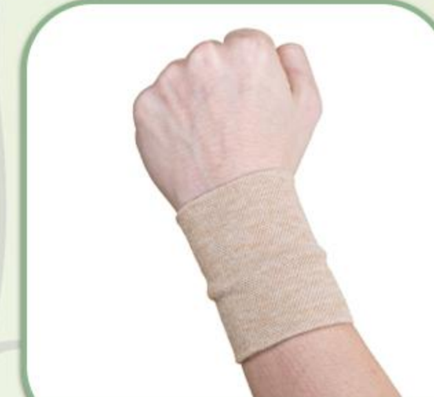
مچ بند الاستیک