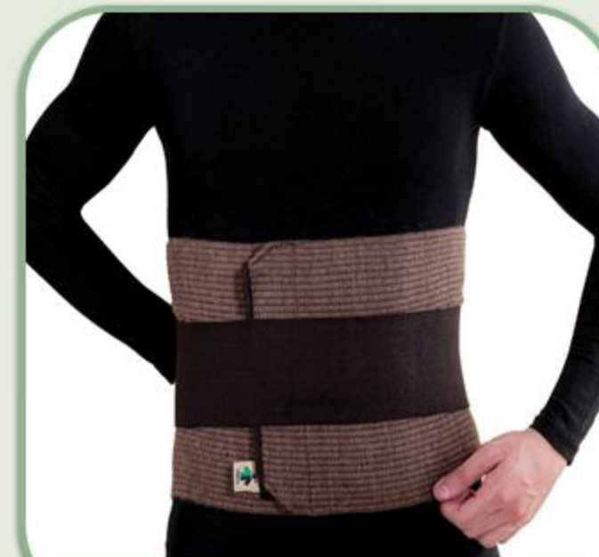
گرم کن کلیه پشمی قابل تنظیم

Woolen Abdominal Support (Without Bar) 81097