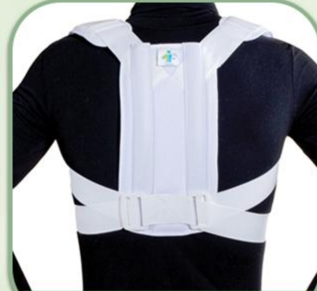
قوز بند پلدار