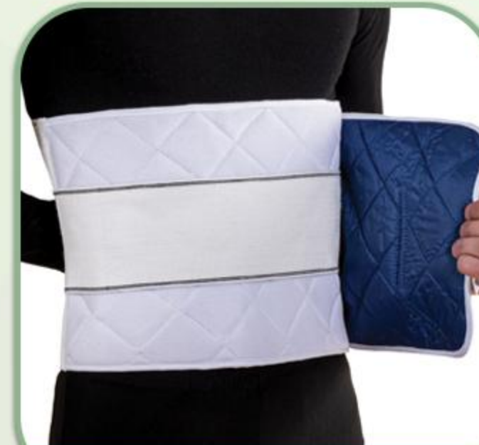
شکم بند لاغری ورزشی