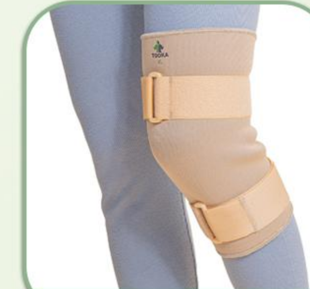
زانو بند کشکک بسته