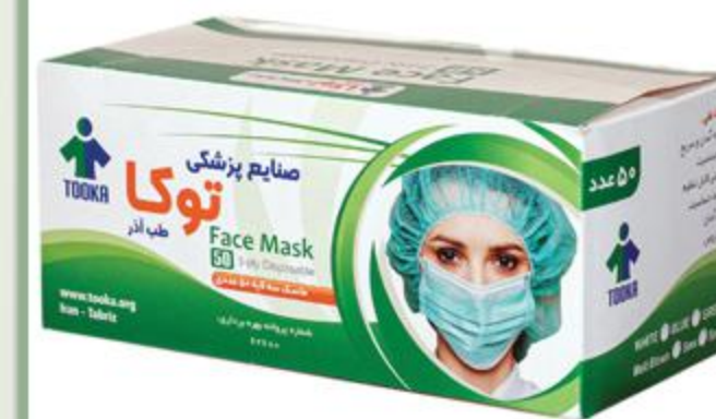
ماسک سه لایه (۵۰ عددی)