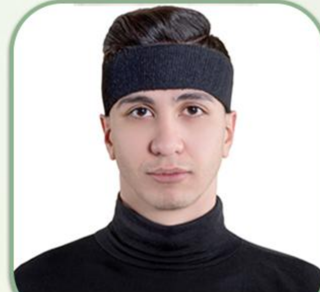
هد بند الاستیک