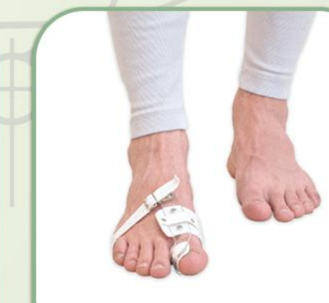
اسپینت هالوکس والوکس