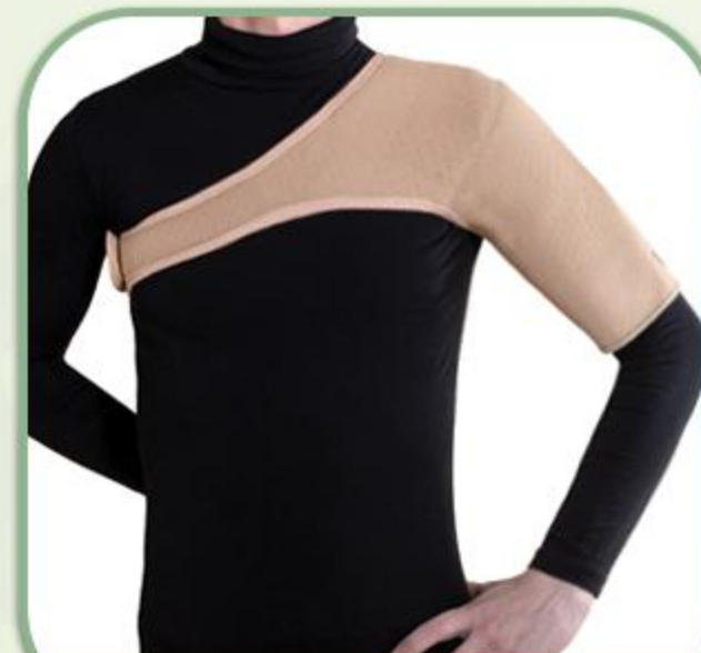
شانه بازوبند یکطرفه