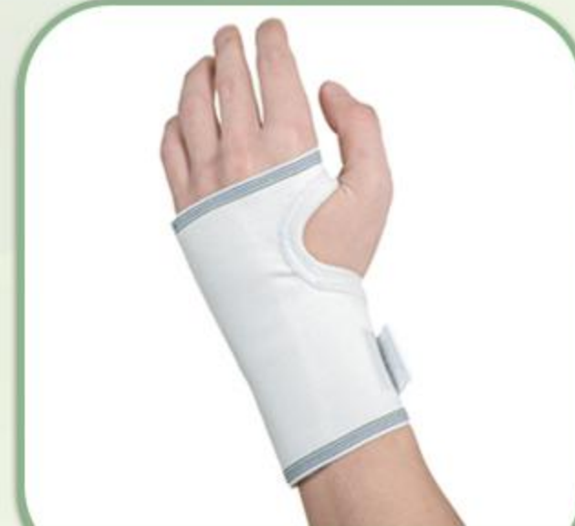
مچ بند پل دار (چپ و راست)