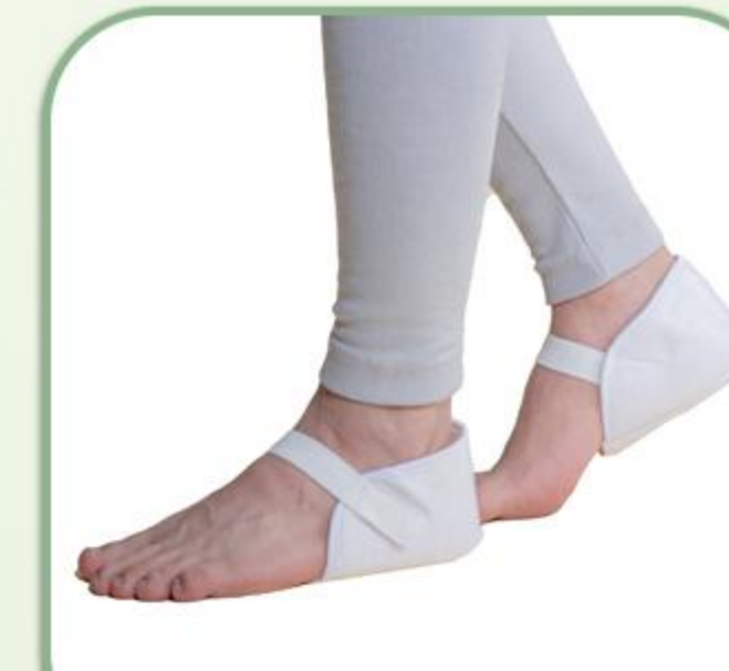
پاشنه پوش طبی