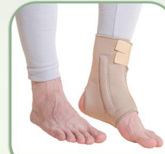
قوزک بند فنردار قابل تنظیم