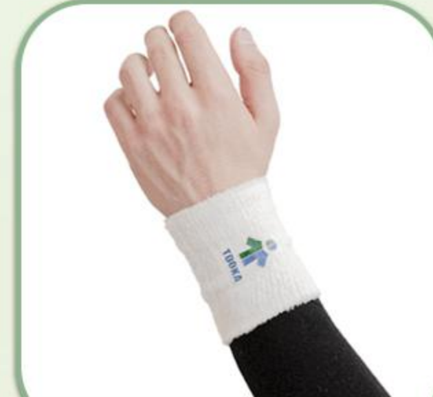
مچ بند حوله ای صادراتی