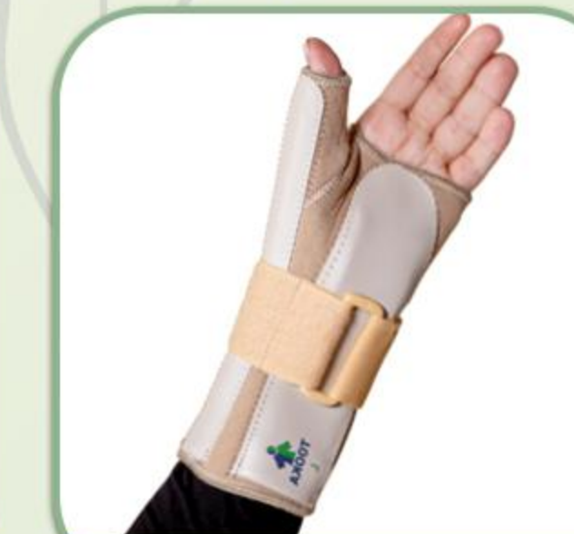
کوکاپ شست بند آتل دار چپ و راست