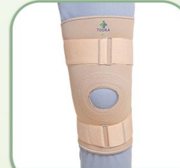
زانوبند ساده با استرپ