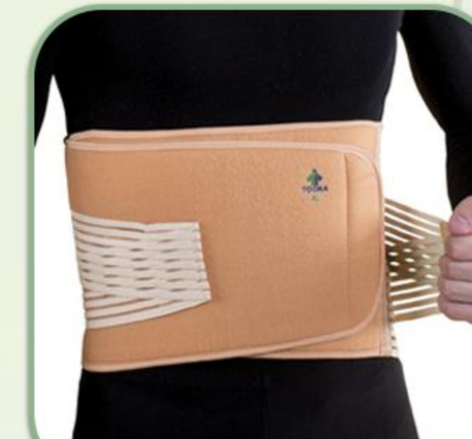
کمر بند طبی صادراتی (۱۵-۲۲-۳۰)