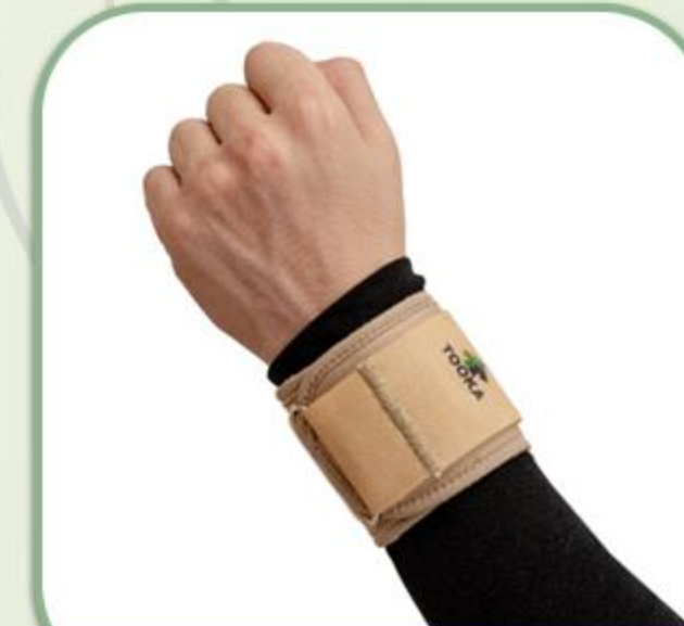
مچ بند قلاب دار قابل تنظیم نخی