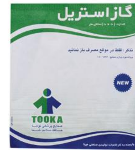
گاز استریل (۷.۵*۷.۵) (۱۰*۱۰)