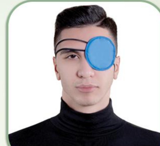
چشم بند یکطرفه