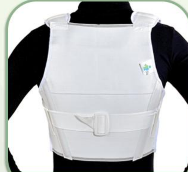
کتف بند الاستیک