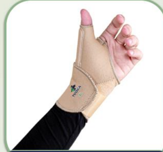
اسپاپکو (شست بند آتل دار باز)